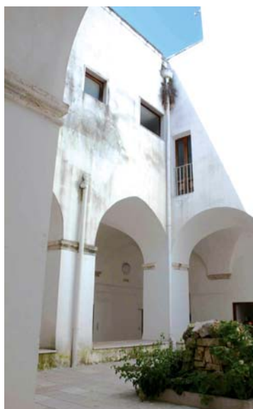
Cortile interno del convento Clarisse

E sabato 13 e domenica 14 giugno, un'anticipazione, si svolgerà la tradizionale Sagra della Ciliegia Ferrovia giunta alla XIX edizione